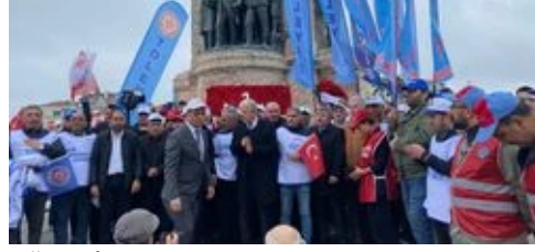
TÜRK-İŞ, Kazancı Yokuşu'na karanfil, Taksim Meydanı'na çelenk bıraktı