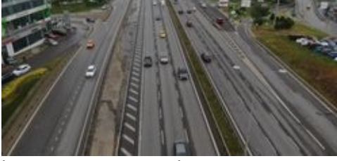
İstanbul'da 1 Mayıs İşçi Bayramı'nda yollar boş kaldı

GÜNCEL POLİTİKA EKONOMİ DÜNYA SPOR MAGAZİN YAŞAM RESMİ İLAN